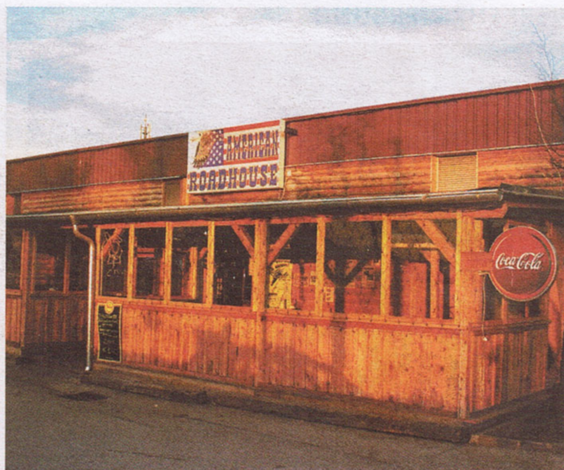
◆ Die Uptown Monotones sind eine von insgesamt neun Acts, die morgen im American Roadhouse zu Gunsten der Kinderkrebshilfe aufgehen KK